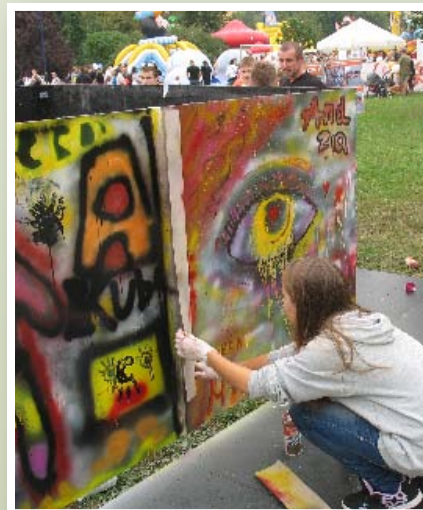
Dzieci malowały kredą na asfalcie, a młodzież przy użyciu sprayów na specjalnej ścianie