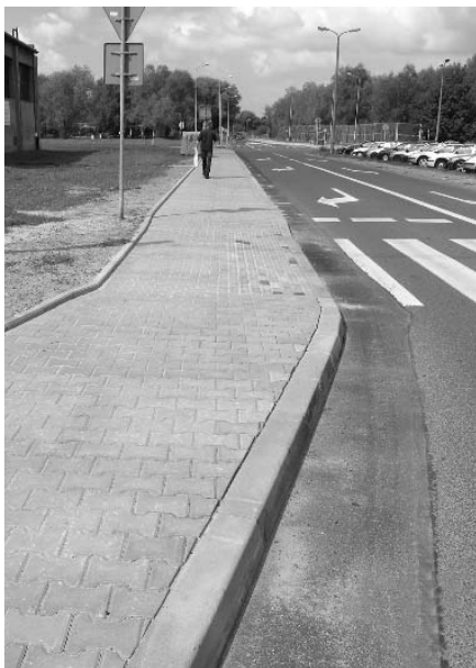
Wyremontowano chodnik przy ul. Heila,

Ostatnie tygodnie przyniosły zakończenie realizacji wielu zadań finansowanych ze środków Rady Dzielnic XI. Oto kilka przykładów w obiektywie Adama Zabdry, Przewodniczącego Komisji Zieleni i Ochrony Środowiska Rady Dzielnic XI.