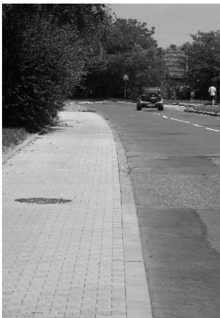
odcinek chodnika przy ul. Cechowej