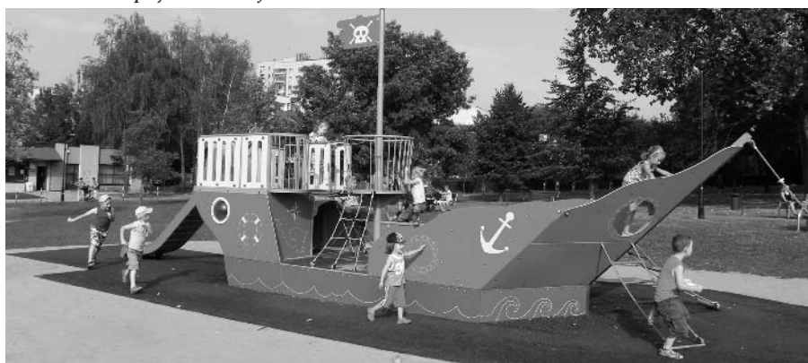
i na terenie Parku Kurdwanów