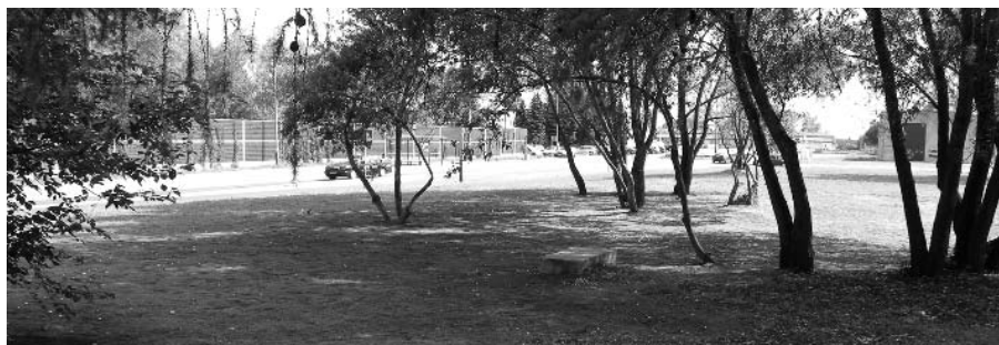
Uporządkowano teren zielony przy ul. Heila, który odstraszał od czasu budowy ul. Nowopuszkarskiej.