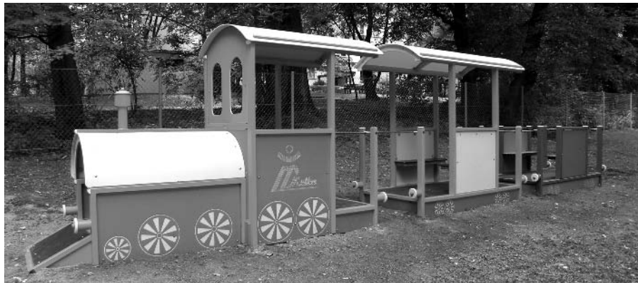
Przedszkola nr 51 przy ul. Estońskiej