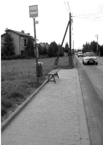
oraz przystanek przy tej ulicy, w pobliżu numeru 83