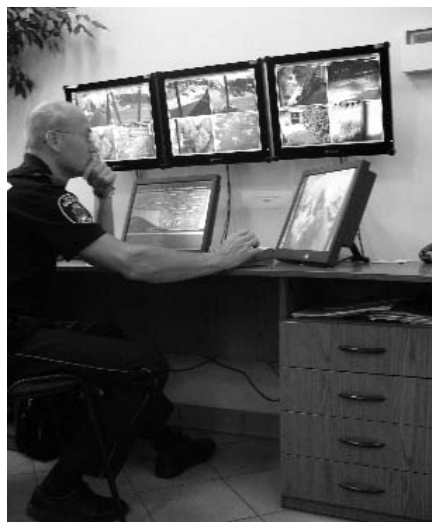
Stanowisko monitoringu wizyjnego w oddziale Straży Miejskiej Miasta Krakowa przy ul. Cechowej

Z innych sytuacji warto wspomnieć o doprowadzeniu do uprzątnięcia 40 zaśmieconych terenów, poinformowaniu odpowiednich służb o 23 awariach infrastruktury komunalnej, 112 interwencjach wobec osób bezdomnych i spowodowaniu wykoszenia Barszczu Sosnowskiego (groźna, parząca roślina osiagająca nawet 4 m wysokości) przy ulicy Turniejowej.