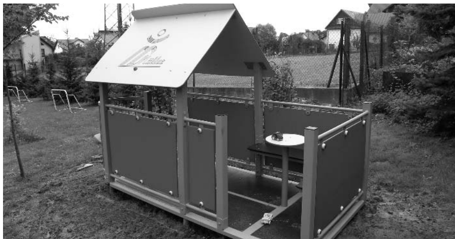
Nowe urządzenia zabawowe pojawiły się w ogródku Przedszkola nr 33 przy ul. Rzęckiej,